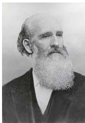
James Springer White (1821-1881)