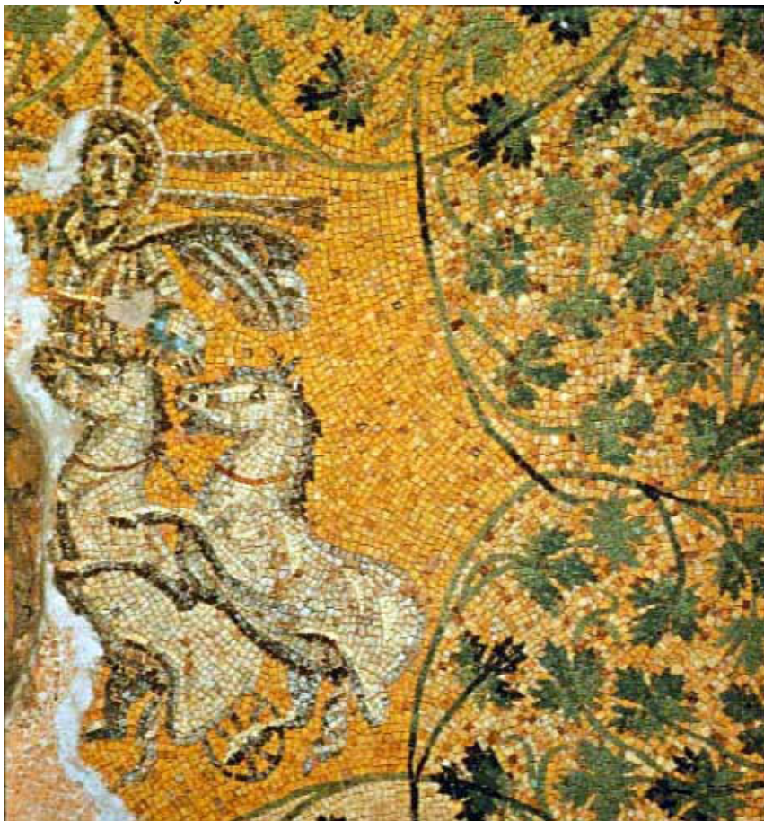
Hrist kao Sol Invictus – mozaik ispod Bazilike Svetog Petra, na